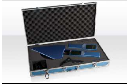
Paquets de mesure (Page 3)