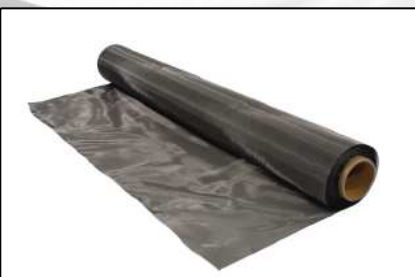
Blindage CEM et RF (Page 12-13)