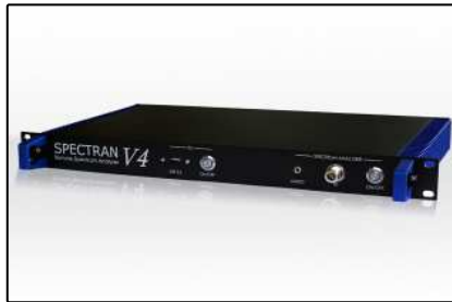
Analyseurs 19 pouces (Page 5)