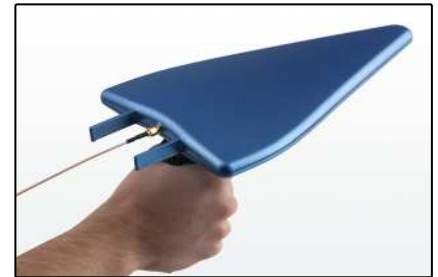
Antennes directionnelles (passives: Page 6, actives: Page 7)