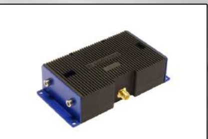
Générateurs (Page 11)