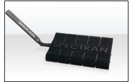
Analyseurs USB (Page 4)