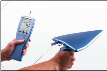
Analyseurs portables (Page 2)