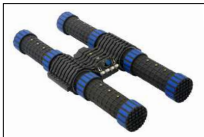
Antennes magnétiques (Page 9)