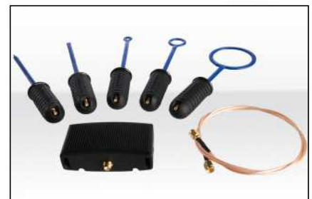
Sondes renifleuses (Page 10)