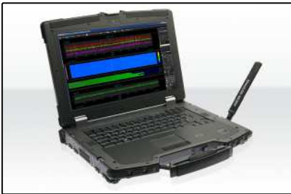
Analyseurs militaires (Page 4)